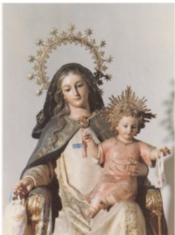
Beata Maria Vergine del Buon Rimedio: Patrona de la Orden

In questo mese di ottobre 2006 si celebra l'80° anniversario dell'istituzione della Giornata Missionaria Mondiale.